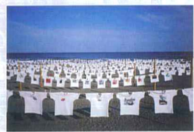
青い空と白いシャツのコントラストが美しい