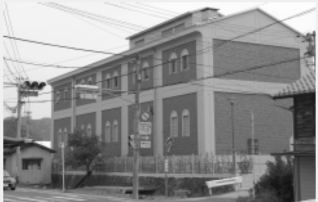
上岡第1浄水場ポンプ棟