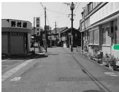
着工前（新屋敷通り）