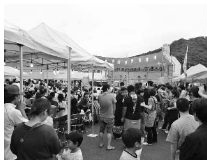
地元の取組（イベントなど）