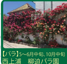
【バラ】5～6月中旬、10月中旬 西上浦 柳迫バラ園