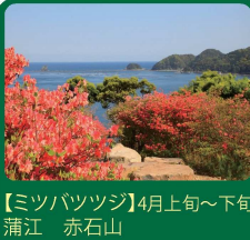
【ミツバツツジ】4月上旬～下旬 蒲江 赤石山