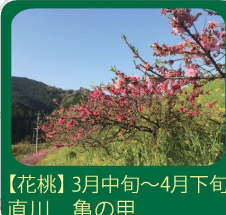
【花桃】3月中旬～4月下旬 直川 亀の甲