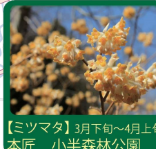
【ミツマタ】3月下旬～4月上旬 本匠 小半森林公園