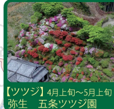
【ツツジ】4月上旬～5月上旬 弥生 五条ツツジ園