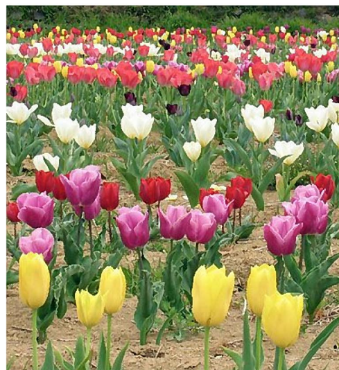
宇目のチューリップ