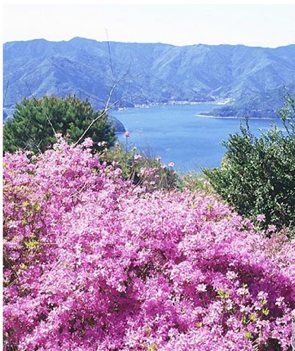
蒲江のフジツツジ