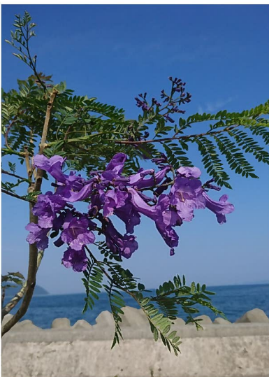
上浦のジャカラダ