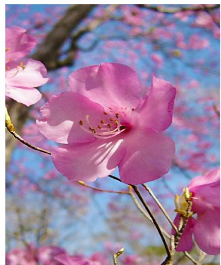
宇目のあけぼのつつじ