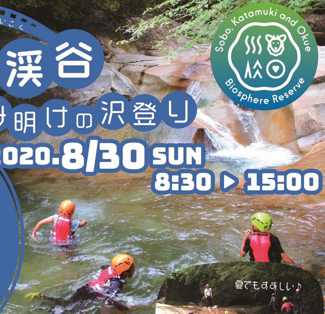
天然のウォータースライダーや 飛び込みスポットで楽しめます♪