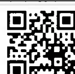
twitter 【佐伯地域ユネスコエコパーク 推進協議会】