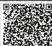
アメーバブログ 【エコパークのあるきかた】