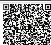
youtube 【佐伯地域ユネスコエコパーク 推進協議会】