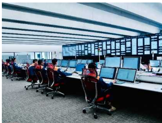
[おおいた消防指令センター]