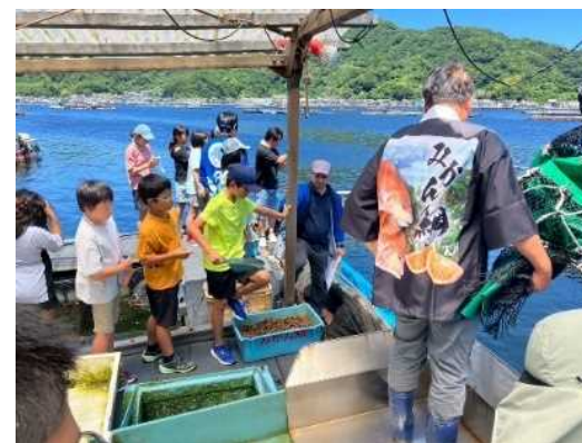
[えひめ・おおいた小学生相互交流事業]