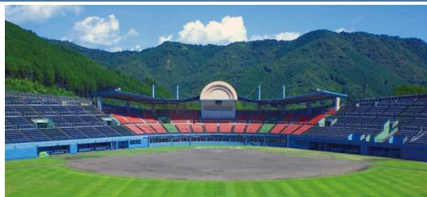
[佐伯市総合運動公園]

※令和8年4月1日 相互利用開始 相互利用施設数 225施設（佐伯市45施設含む）