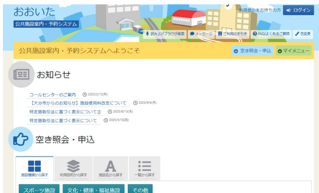
[おおいた公共施設案内・予約システム]