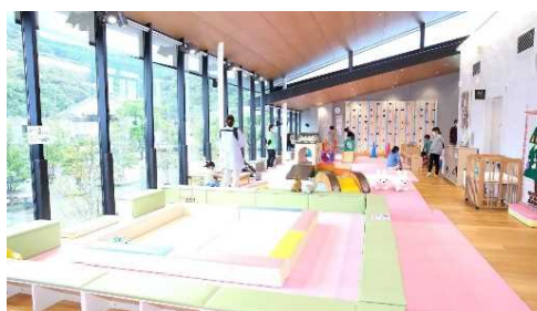
[子育て・子育て支援室 さくらっ子「さくらっ子広場」]