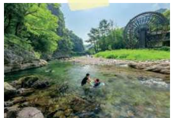
小半森林公園の風景