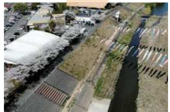
道の駅やよいと井崎川