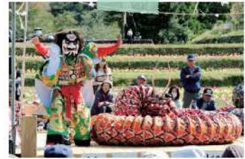
重岡岩戸神楽保存会