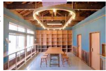
空き家を改装したコミュニティカフェ