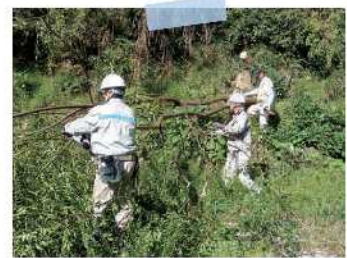
直川地域協力隊による活動