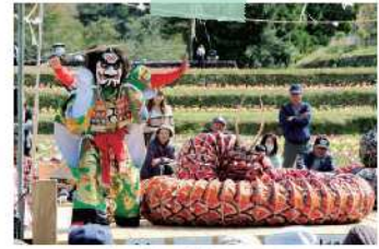
重岡岩戸神楽保存会