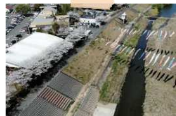
道の駅やよいと井崎川