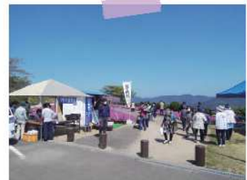
米水津空の展望所「空カフェ」