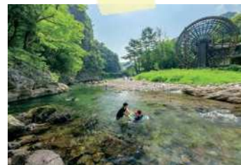
小半森林公園の風景