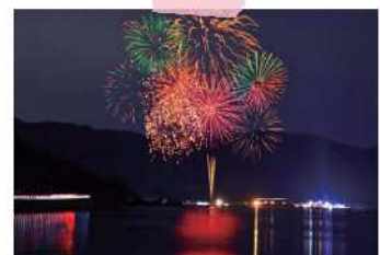
かまえインターパークからの花火