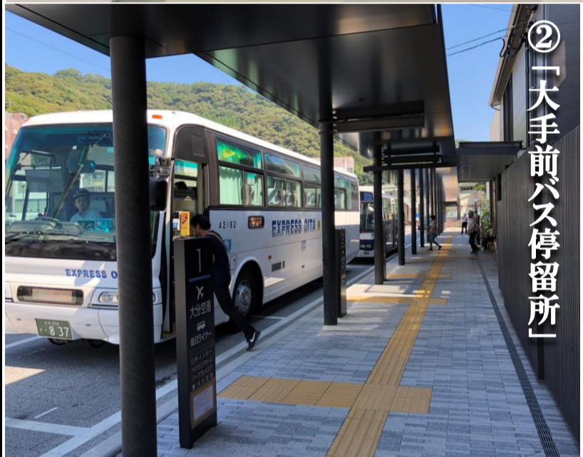
②「大手前バス停留所」

創刊 2018年（平成30年） 佐伯市役所 大手前開発推進室 ☎0972-22-4623