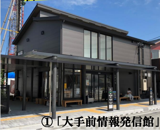
①「大手前情報発信館」

誕生「大手前情報発信館」が、新たな市内に。この建物は、1階部分は、男女物販スペースを設け、2階部分には、市民利用のスペースを設けます。