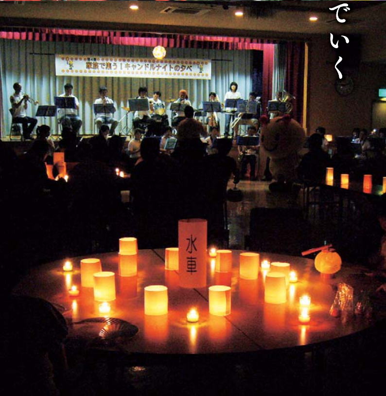
キャンドルナイト

大分、宮崎県境にある「祖母傾山系(そぼかたむきさんけい)」の、国連教育科学文化機関(ユネスコ)認定エコパーク(生物圏保存地域)登録を目指す。(写真は藤河内渓谷)