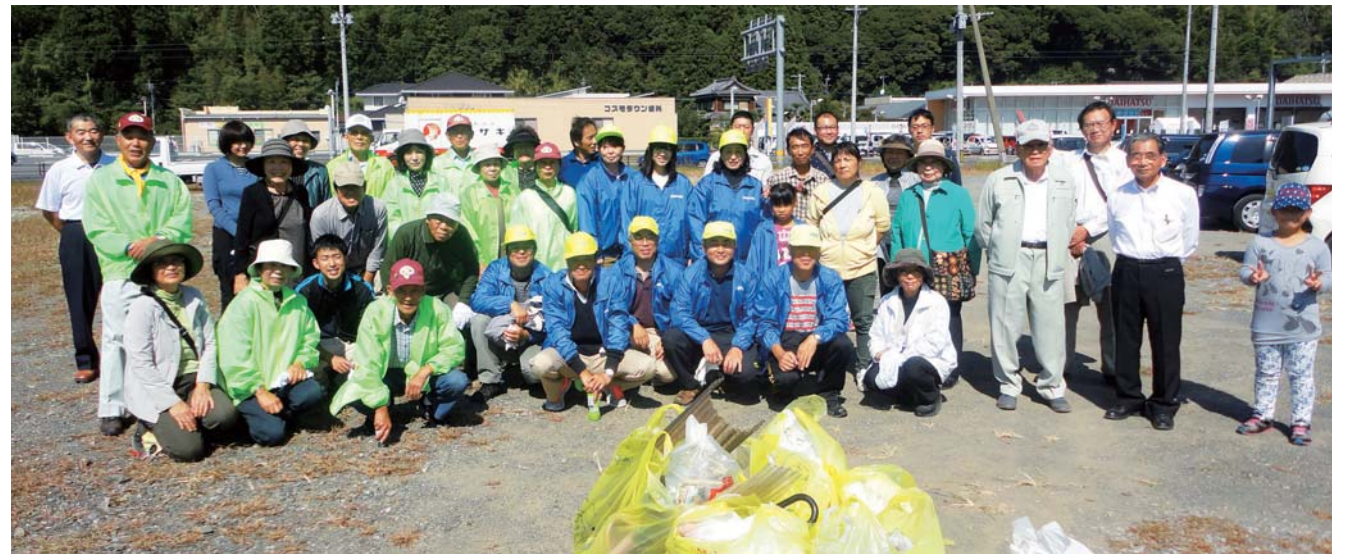
さいき903エコ推進会議と市が共催する、市民による一斉清掃活動「さいき903クリーンアップ大作戦」。市民への認知を図り、積極的に参加してもらうことで、環境づくりに市民が一体となって参加するまちを目指す。