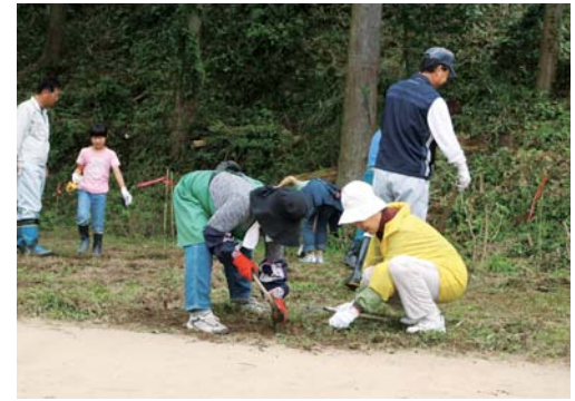
各地域で自発的に行う環境美化活動や緑化活動、再生資源に係る回収活動など、地域に根ざした環境保全活動を展開している。

平成26年にはバイオマス産業都市の認定を受け、バイオマス産業を軸とした環境に優しく災害に強いまちづくりを進め、クリーンエネルギー産業の創出を目指しています。ほかにも、花のあるまちづくりや大分県キャンドルナイトへの参加など、多岐にわたる方面から環境保全に努めています。