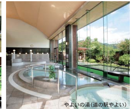
やよいの湯(道の駅やよい)