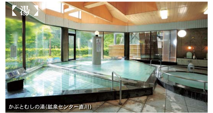
かぶとむしの湯(鉱泉センター直川)