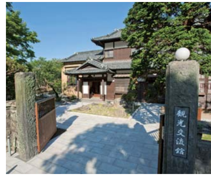
散策や休憩ができる開放的な庭園、屋外から直接利用できる多目的トイレを備える。

佐伯市城下町観光交流館 昭和11年の建築とされる「つたや旅館」の建物を保存しながら、観光客や市民が気軽に休憩できる観光情報発信拠点として平成27年に整備。ギャラリーや観光情報コーナーを設置。