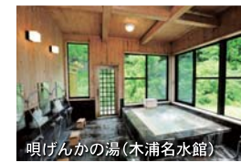
唄げんかの湯(木浦名水館)