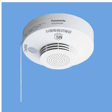
火災センサー(火災報知器)