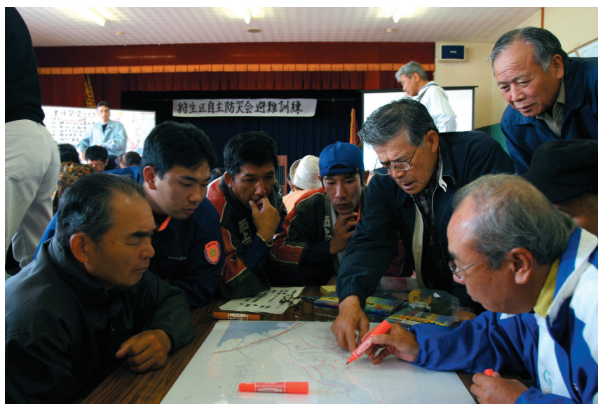
自主防災組織の訓練

高齢化が特に進む本市では、地域とのつながりを保つ中で、安心して充実した生活が送れるように、地域福祉の充実に努めます。