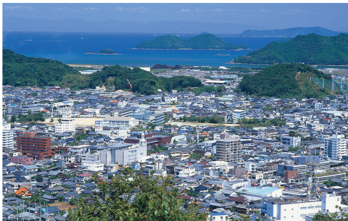
城山から見た市街地風景

この地区は、駅、港という公共交通の重要な要の位置にあり、今後、この地区の整備計画を作成し、にぎわいの再生に向け、事業を実施することとしています。