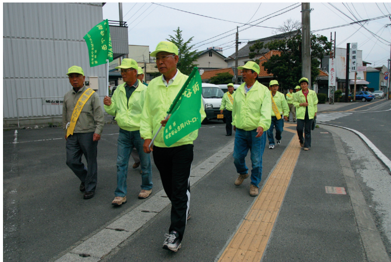
安心・安全パトロール

このように、これからのまちづくりは、「責任をもって、自ら考え、自ら行動すること」を基本理念とします。これにより、「自助・共助・公助」の考え方の下、市民の自助努力と相互の助け合いによる「市民主体のまちづくり」を進めていきます。