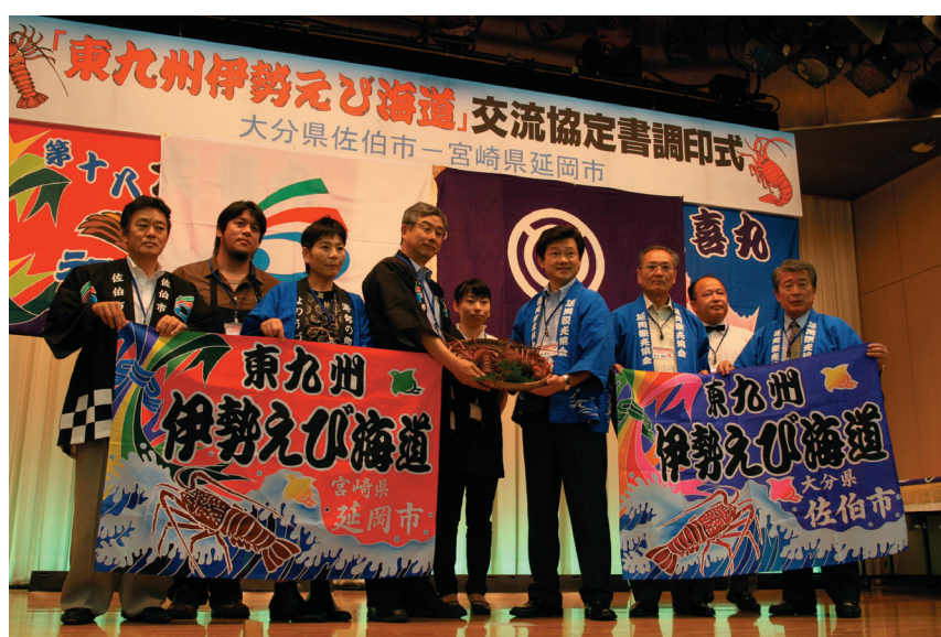
東九州伊勢えび海道

交流人口の増加を実現するには、本市全体に「おもてなしの心」を醸成し、「住んでよし、訪れてよし」の心温まるまちづくりを進める必要があります。そこで、明るく、気持ちのよい「あいさつ」や「地域の清掃活動」の率先励行など、「おもてなしの心の運動」を展開します。