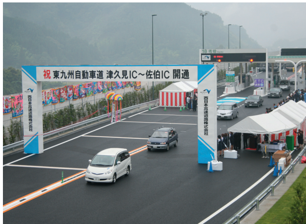
東九州自動車道 佐伯ICの開通