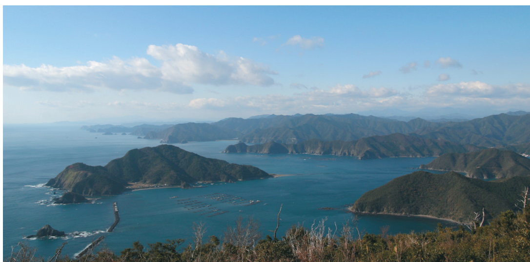
広大な海とリアス式海岸

「まちの将来像」とは、この総合計画の目標年度である平成29年度に、「こうなっていたい」というまちの姿です。わたしたちのまちは、903平方キロメートルという九州一の面積を誇ります。この広大な土地は、温暖な気候の下、祖母傾国立公園の一角をなす森林地域と、番匠川水系等の清流に育まれた田園地域と、日豊海岸国立公園に指定された269キロにおよぶリアス式海岸地域からなっています。さらに、本市には、これらの豊かな自然を背景に、新鮮で豊富な食材とこれらを使ったおいしい料理、厚い人情、治安のよさなど、人がこころ豊かに暮らしていくための基礎的条件がそろっています。このような本市の姿は、「健康と環境を志向するライフスタイル」である「ロハス」(注2)の思想を具体化するものであり、都会人などにとっては、まさしく広大な「癒しの地」であるといえます。