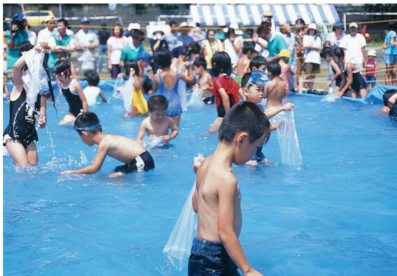
地域のイベントに参加する子どもたち

（注）人口推計にはさまざまな手法があり、手法によって推計値は異なる場合があります。この計画では、国勢調査による人口を基礎として、出生率や生存率などの推測変動値を加えるコーホートセンサス変化率法を用いて、10年後の人口を予測しました。