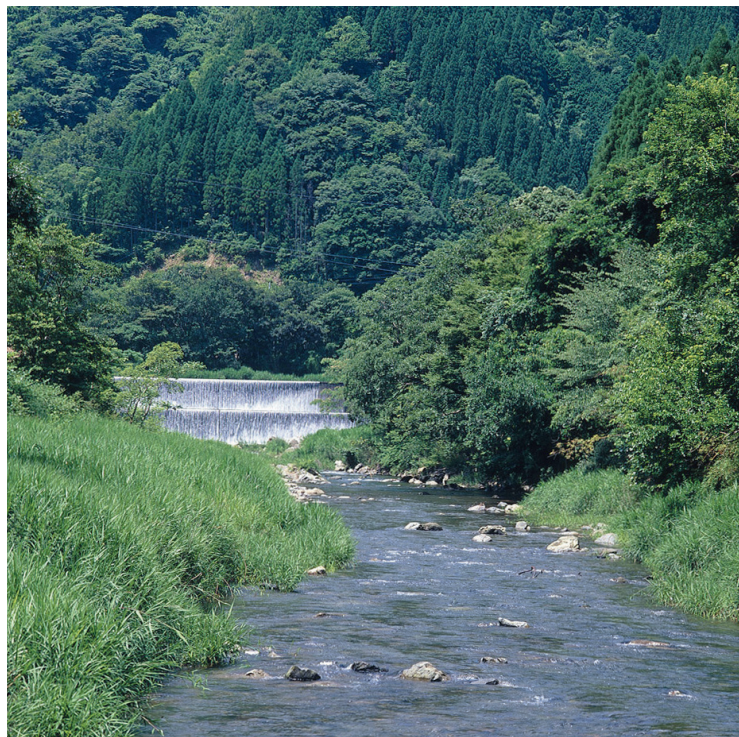
清流と緑あふれる自然

今後、地域資源に一層の磨きをかけるなど、地域の魅力アップを図る一方、空き家バンクをはじめとする各種情報の発信を行うなど、都市からの移住等の促進に向けた総合的な定住促進対策を推進します。