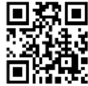
確定申告書等作成コーナー QRコード

マイナンバーカードを利用したスマホ申告がますます便利になっています。国税庁ホームページの「確定申告書作成コーナー」では、画面の案内に沿って金額等を入力するだけで、スマホから所得税、消費税及び地方消費税、及び贈与税の申告書や青色申告決算書・収支内訳書の作成、e-Taxによる送信が可能で、自動計算のため計算誤りがありません。ご利用にはマイナンバーカードの上記2種類のパスワードが必要です。