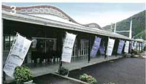
1 新鮮な魚類は佐伯の宝。2 ブリをもっと美味しく！研究中。3 道の駅かまえから世界へ！夜は幟屋員のランタンが灯ります。