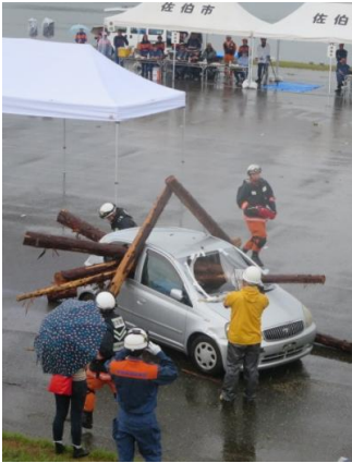
(昨年度の訓練の様子)