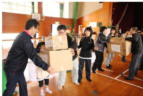
避難者が物資搬入の手伝いをしている様子

11月9日佐伯市全域で地域避難訓練が行われました。訓練内容については、各地区で検討し実施されましたが、雨天のため、訓練を中止した地区もあり、昨年より参加者は少ない状況でした。