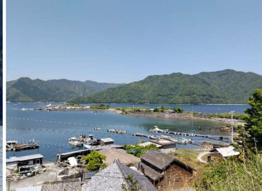
洲崎 ～入津湾の入口に約50mに及ぶ砂州が広がる(蒲江西野浦)