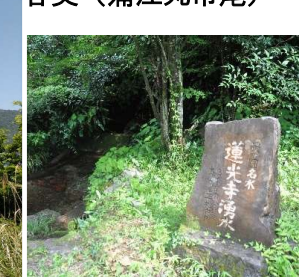
蓮光寺湧水 ～豊の国名水に選ばれた鉾山に湧き出る湧水(宇目木浦鉾山)