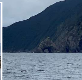
宇土崎洞門 ～海岸の岩礁が波の浸食でできた大洞門(蒲江波当津)