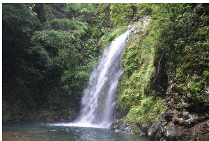
銚子の滝 ～銚子八景の一つ、清流と奇岩の景勝地(本匠小川)

名勝とは、美しい景色や自然学術上価値の高い場所を指し、市内7カ所が県や市指定の文化財となっています。