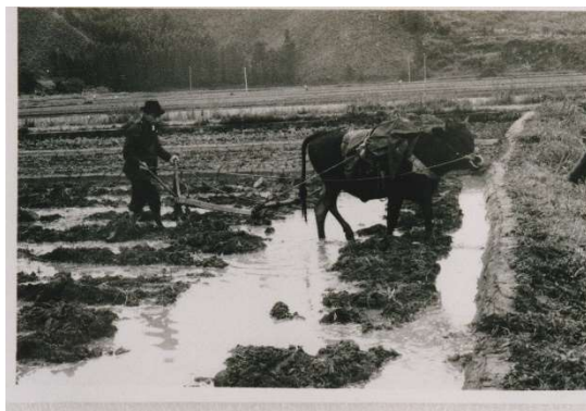
昭和30年代農耕作業風景 牛馬を使った田起こしの様子