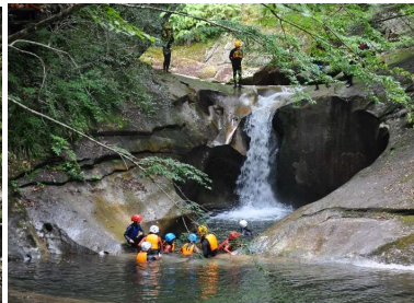
藤河内溪谷 ～上流の観音滝(右写真)から続く花崗岩の様々な罅穴群が感動的な溪谷(宇目藤河内)