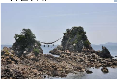
豊後二見ヶ浦 ～女岩と男岩から昇る日の出は必見。上浦のシンボル(上浦津井)