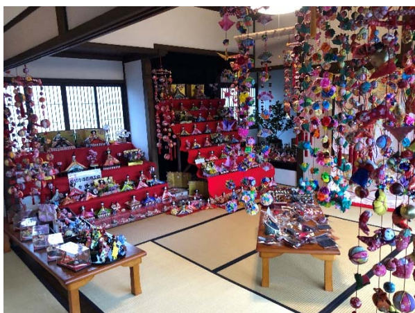
城下町佐伯ひなめぐり

本戦略では、主に佐伯の外から佐伯を訪れる機会を広く「観光」、「ツーリズム」として捉え、まちづくりや移住定住施策との連携を図りながらその振興を図ることで来訪者を増加させ、地域産業の振興に資することを主旨とし、市内の観光に関わる関係者が一丸となった取り組みを進めていきます。