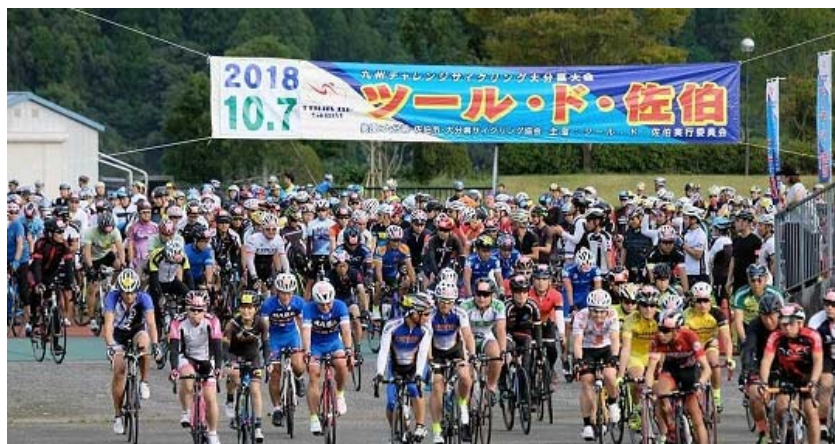
ツール・ド・佐伯

東九州自動車道に近接し九州屈指の規模を誇る「佐伯市総合運動公園」をはじめとする体育施設や令和2年秋にオープン予定の「さいき城山桜ホール」などの施設を活かし、各種スポーツ大会や合宿の誘致、文化芸術系団体の発表会、研修会を誘致する取り組みを進めます。また、歴史、産業、防災、まちづくりなどの学術研究を目的とした団体活動についても積極的に受け入れます。