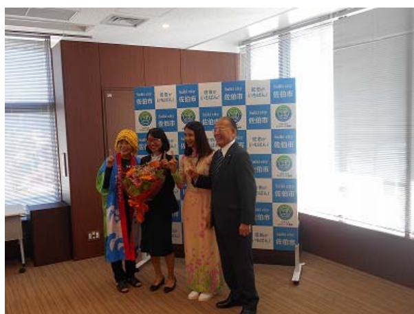
ベトナム人研修生受入

今後日本国内で相次いで開催されるラグビーワールドカップ、東京オリンピック・パラリンピック、ワールドマスターゲームズ観戦、大阪万博を目的とした来日者数の増加を見据え、また、主要観光地の動向や福岡空港への定期航路新設に向けた活動等を注視しながら誘客策の検討を進めます。また、プレミアムクラス及びラグジュアリークラスの中小型船を中心としたクルーズ客船の誘致を目指します。