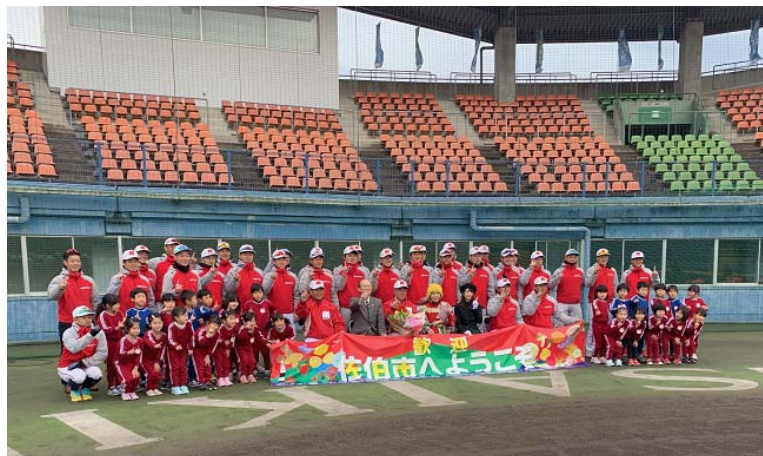
社会人野球チーム合宿歓迎式

高速道路からのアクセスが抜群で、かつ九州でも有数の規模を誇る佐伯市総合運動公園のポテンシャルを生かし、各種スポーツ大会やスポーツチームの合宿誘致に取り組めます。また、佐伯市総合運動公園を拠点に番匠健康マラソン大会やツール・ド・佐伯をはじめとする各種スポーツイベントも開催されており、それらを梃子にした誘客活動を展開します。