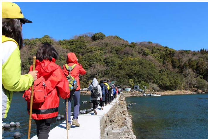
九州オルレさいき・大入島コース「海の中道」