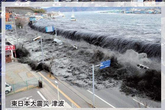
東日本大震災 津波