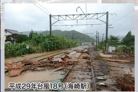
平成29年台風18号(海崎駅)

託児 (無料) 託児を希望される方は 1月20日(水) までに お気軽にお電話ください