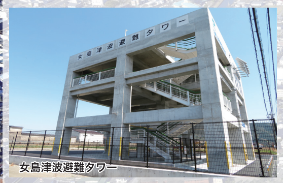
女島津波避難タワー