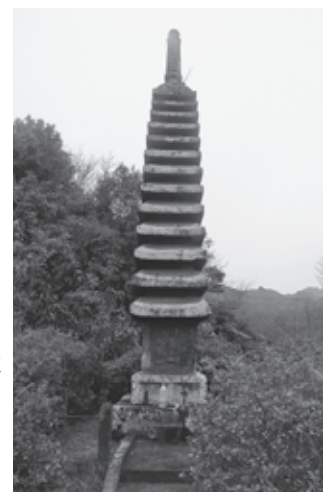
十三重の塔(上岡地区)