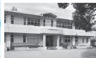
名護屋小学校森崎分校