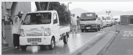
エコセンター番匠の混雑状況

なお、年末は通常の約3倍の持込みがあります。大変混雑しますので、早い時期から計画的に片付けを行いましょう。