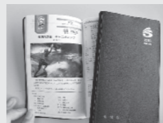
今年のカバーは茶色です。