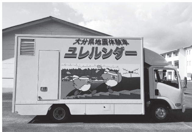
地震体験車ユレルンダー