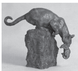
朝倉文夫《よく獲たり》

■とき 11月10日(火)～13日(金) 9時～17時(10日はオープニングセレモニーのため9時50分～、13日は16時まで) ※10時～12時、14時～16時は中学生を対象にした鑑賞授業を行っていますが、一緒にご覧いただけます。 ■ところ まな美1階市民ギャラリー ■入場料 無料 ■駐車場は、「まな美」または「市役所」の駐車場をご利用ください。