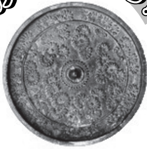
写真は、佐伯市大字鶴望で発見された銅鏡