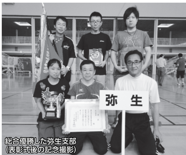
総合優勝した弥生支部 (表彰式後の記念撮影)

6月7日・14日・21日の3日間、総合運動公園をメイン会場に第7回佐伯市地区対抗スポーツ大会が開催されました。今年度は8種目が行われ、19地区・支部が参加しました。