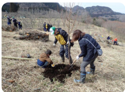
第27回ボランティアによる森林づくり (大分市)