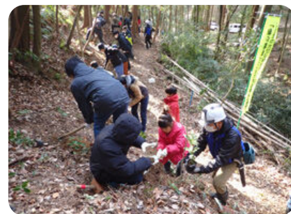
街の里山再生事業 (大分市)