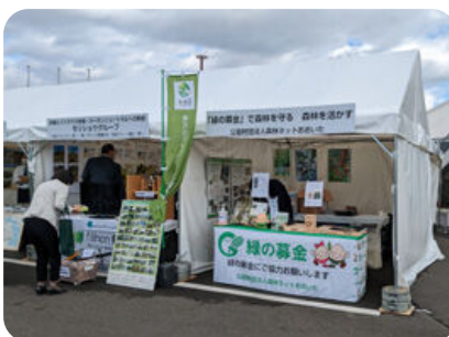
緑の募金普及啓発活動 (事業紹介ブースの設置)