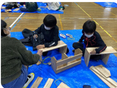
木工教室 (各市町村)