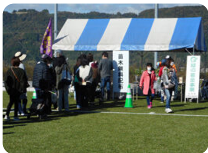
緑化木無償配布 (各市町村)