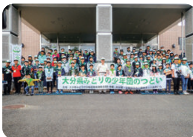
みどりの少年団活動支援 (大分県みどりの少年団のつどい)