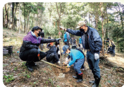
街の里山再生事業