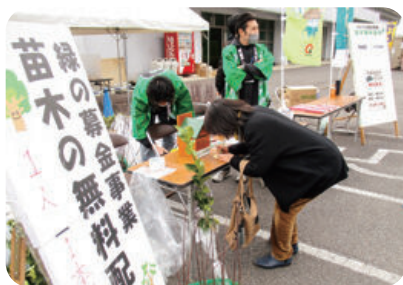
緑化木無償配布 (各市町村)