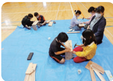
木工教室 (各市町村)