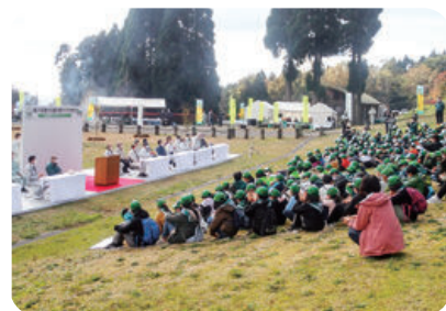
第21回豊かな国の森づくり大会 (豊後大野市)