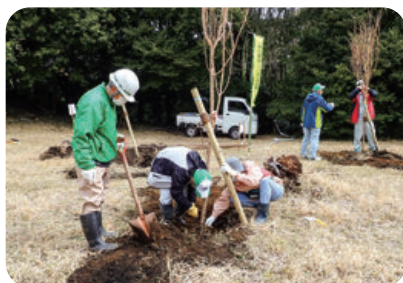
第26回ボランティアによる森林づくり (大分市)