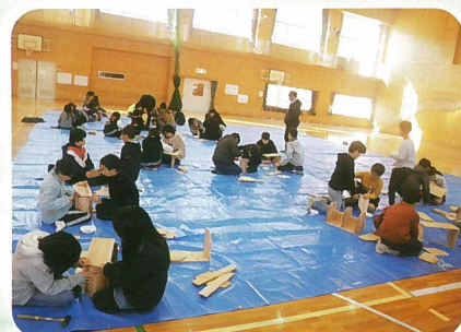
木工教室 (各市町村)