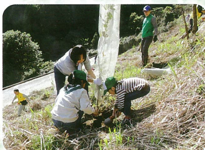
豊かな国の森づくり大会 植樹活動