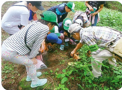
みどりの少年団自然観察会