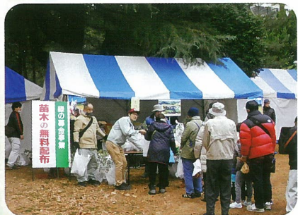
緑化木無償配布（各市町村）