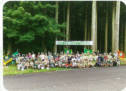
みどりの少年団つどい