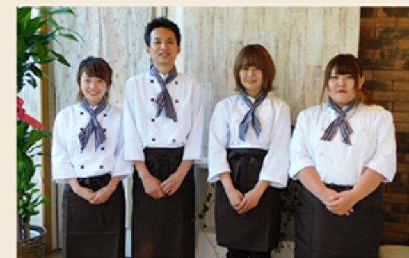
「Cafe Rin」笑顔が素敵なスタッフの皆さんがお待ちしております