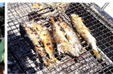
炭火で焼いた鮎は格別うまい