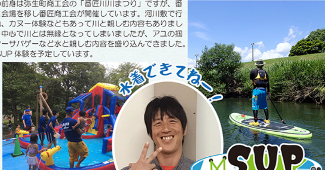
ウォータースライダー

祭りの最後には地元の特産品も飛び交うもちまきもありますので、多くの皆様のお越しをお待ちしています。