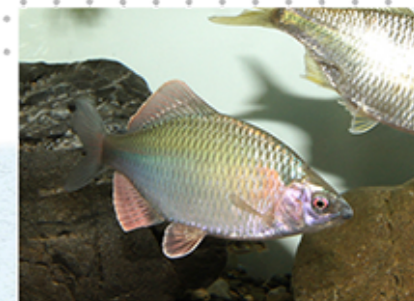
↑美しいカネヒラのオス(タナゴの仲間)

展示する魚はスタッフが現地でも捕まえた魚たちがほとんどで、オスがきれいなタナゴの仲間や、エラに眼の模様をもつオヤニラミ、石のようなカジカ、繁殖前まで眼がないスナヤツメなど18種を展示。これはまさに期間限定の「大分おさかな館」となりますので、是非見に来てください。