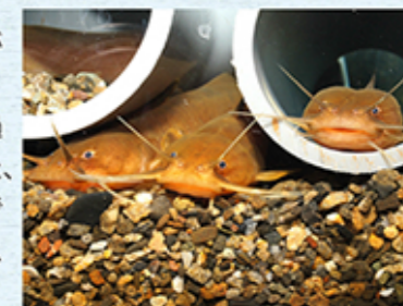
←4対の口ヒゲをもつアカザ。背ビレと胸ビレに毒針をもつ。(ナマズの仲間)