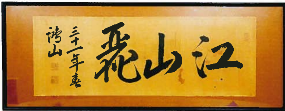
毛利高範書「江山麗」

今回の展示では、旧佐伯藩主毛利家13代当主・毛利高範が市民に贈った書や、佐伯堅田出身で幕末に活躍した青木猛比古の鎧などを展示し、資料館の収集活動の成果を紹介します。先人から受け継がれてきた郷土の宝をとおして、佐伯の歴史に触れてみませんか。