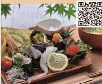
海宝寿司と夏野菜の天婦羅プレート 1,980円(税込)

佐伯市米水津大字浦代浦680 TEL.080-8563-7232 営業時間/12:00～16:00 ※要予約(ネット/電話) 定休日/不定休