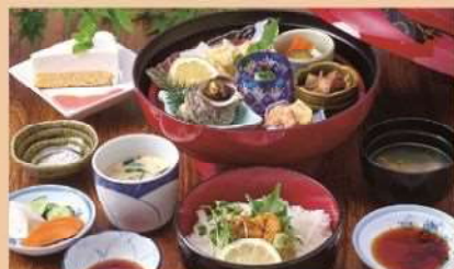
イカとサザエの浦先膳 2,800円(税込)