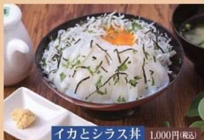
イカとしらす丼 1,000円(税込)

主催：鶴見地域創生支援協議会/米水津地域創生支援協議会 協賛：佐伯市観光協会鶴見支部/佐伯市観光協会米水津支部