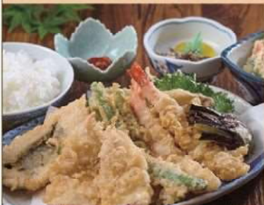
海鮮テラス天麩羅定食 1,500円(税込)

佐伯市鶴見大字地松浦1351-1 TEL.0972-30-1170 営業時間/11:00～15:00(L.O.14:30) ※夜は予約のみ 定休日/日曜日