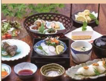
イカとサザエの伊勢家会席 4,000円(税込)

佐伯市鶴見大字地松浦26-3 TEL.0972-33-1358 営業時間/11:30～15:00 ※前日までの予約のみ 定休日/予約のみ営業