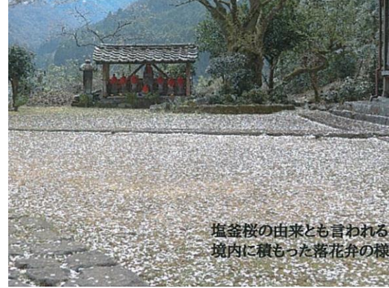
塩蓋桜の由来とも言われる 境内に積もった落花弁の様