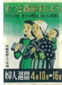
第1回婦人週間ポスター (1949年)

この度、上記行政資料及び展示貸し出し資料を譲渡することとなりました。譲渡のお申し込みはHPから可能です。あわせて譲渡会の開催も予定しています。譲渡の詳細や譲渡会の日時等については、別途女性就業支援バックアップナビ ( https://joseishugyo.mhlw.go.jp/ ) にてお知らせいたします。