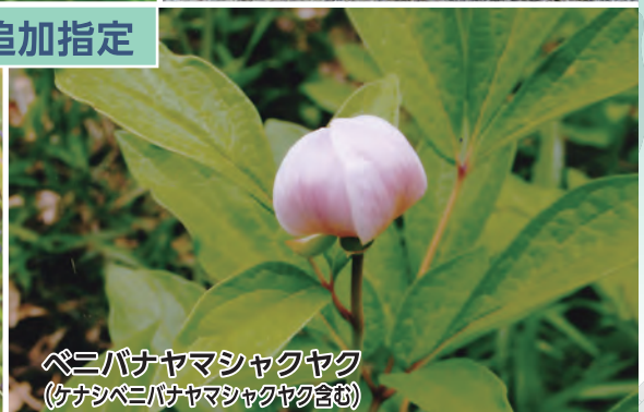
ペニバナヤマシャクヤク (ケナシペニバナヤマシャクヤク含む)

本県は豊かな自然に恵まれ、そのなかに多くの野生動植物が育まれています。生物多様性を支えるこれらの野生動植物を守ることは、私たちの健康で文化的な生活を確保することにもつながる極めて大切なことです。しかし、様々な開発や過剰な捕獲等により、多くの種が絶滅し、また、絶滅のおそれが増大しつつあります。