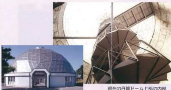
現在の丹賀ドーム上部