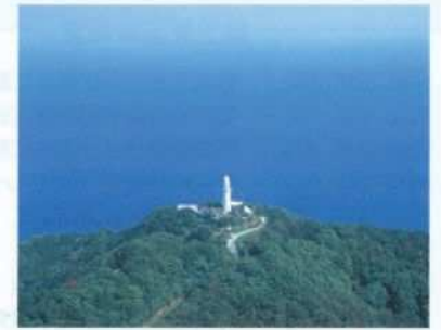
現在の鶴御崎灯台

昭和17年3月から鶴御崎先端現鶴御崎灯台背面の山頂に、射距離2万200メートルの15センチカノン砲四門の砲座砲台を起工し9月に竣工しました。しかしこれは空襲の激化により、昭和20年鶴御崎灯台北側崖に洞窟砲座を築いてここに移設しました。またその跡は鶴見崎第二砲台となり15センチ榴弾砲四門などが配備されました。