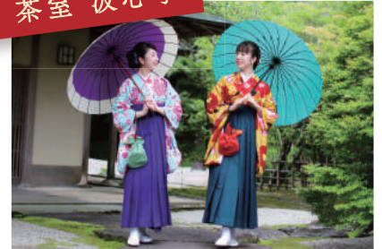
緑に囲まれたお茶室で 一服いかが？