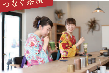
おしゃれなカフェでパチリ！