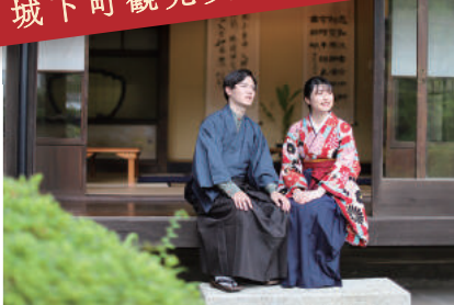
レトロな雰囲気かステキ♪