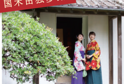
昔、文豪が住んでいたそう。 文豪の気持ちになれるかな？