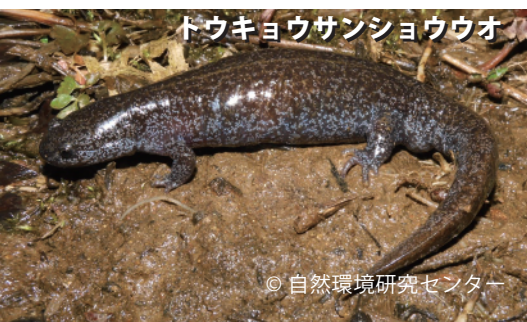
トウキョウサンショウウオ