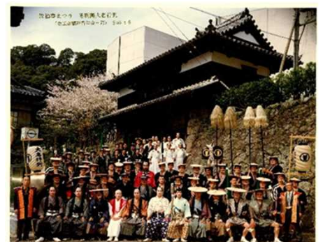
設立当初の大名行列集合写真

当初、衣装などはレンタルの予定でしたが、今後も継続していきたいとの思いから、京都まで衣装の買い付けに赴き、準備が行われました。その都度試行錯誤を繰り返していく中で、まつりにはなくてはならないものとなり、令和4年度に無事40回目を迎えることができました。