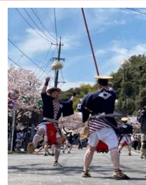
大名行列演舞の様子