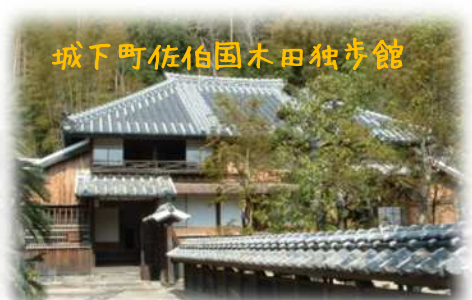
城下町佐伯国木田独歩館