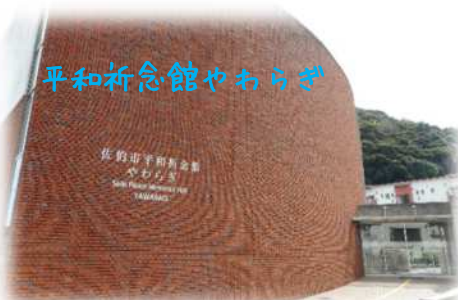
平和祈念館やわらぎ