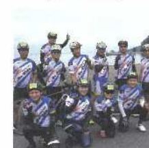
ツール・ド・佐伯