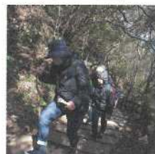
SEA & FOREST WALK