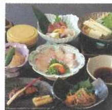
天然寒ブリ フェア