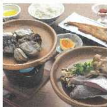
桜鯛と 真牡蠣フェア