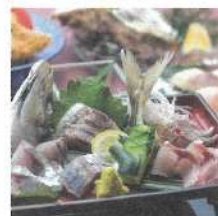
アジとイサキ フェア