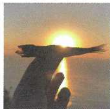
初日の出 @鶴御崎灯台