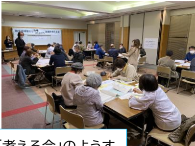
「考える会」のようす

設立準備会に先立ち、4月～6月 区長会、社会福祉協議会、民生・児童委員協議会など各種団体に、これまでの取組状況、これからの計画等を報告しました。