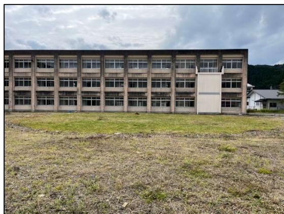
(令和5年10月の現地の様子)