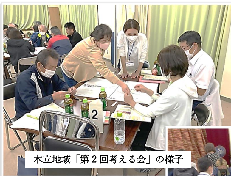
木立地域「第2回考える会」の様子