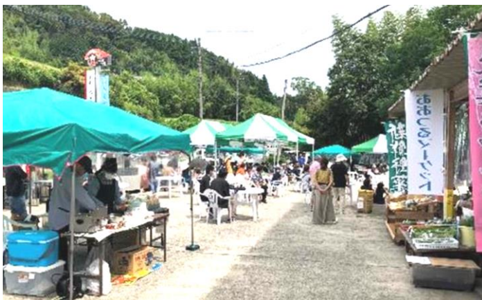
📍視察研修予定「大津留まちづくり協議会」

「考える会」では、先進地の取組を学習し、木立地域での取組の参考とするため、由布市の「大津留まちづくり協議会」を視察研修する予定です。 ※研修状況や内容については、実施後に改めてお知らせします。