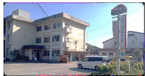
📍大津留まちづくり協議会が毎月第4日曜日に開催している「おおつるマーケット」の様子