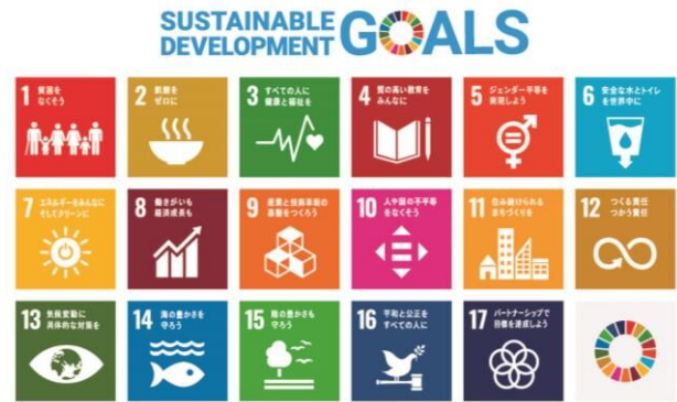
▲SDGs の 17 の目標アイコン

本計画では、「第 4 章まちづくりの方針（全体構想）」において、各方針と 17 の目標の関連を示しています。