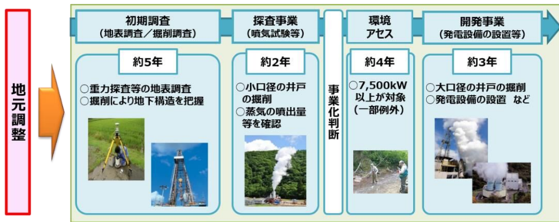
図 地熱発電事業の一般的な開発プロセス

※環境影響評価法（平成9年法律第81号）に基づく環境アセスメント手続については、前倒環境調査を適切に実施した場合には、短縮が見込まれている。また、井戸の掘削期間の短縮化に向けた技術開発なども行われている。