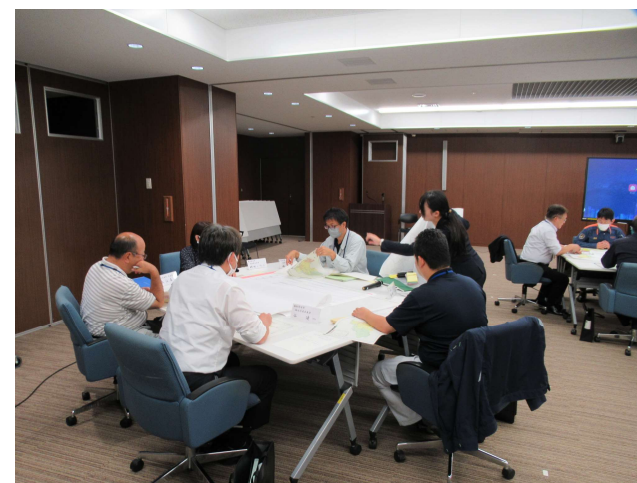
第3回プロジェクトチーム会議