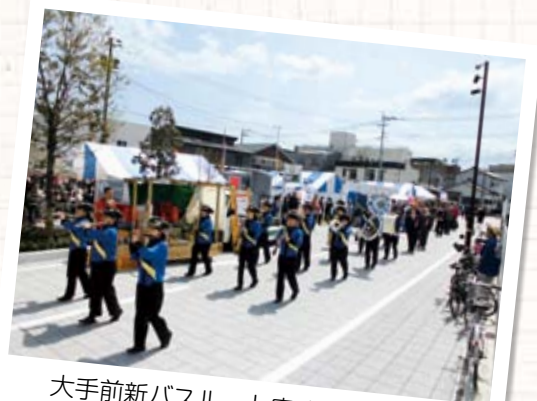
大手前新バスルート完成セレモニー