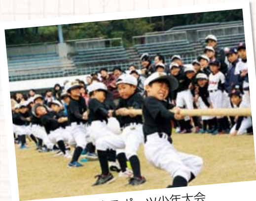
佐伯市スポーツ少年大会