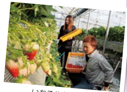
いちごハウス栽培