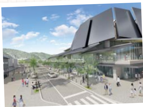
大手前まちづくり交流館（仮称）イメージ図