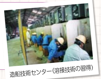
造船技術センター(溶接技術の習得)