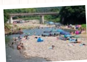
宮ノ越遊水公園河川