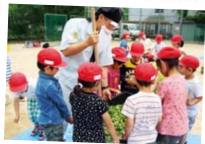
生ごみリサイクル菌ちゃん野菜教室