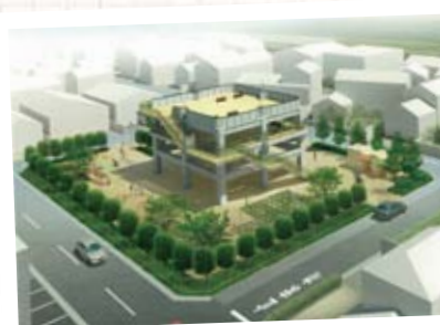
津波避難タワー（池船地区）イメージ図