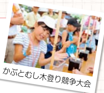
かぶとむし木登り競争大会