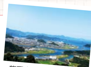
龍王山からの佐伯地域