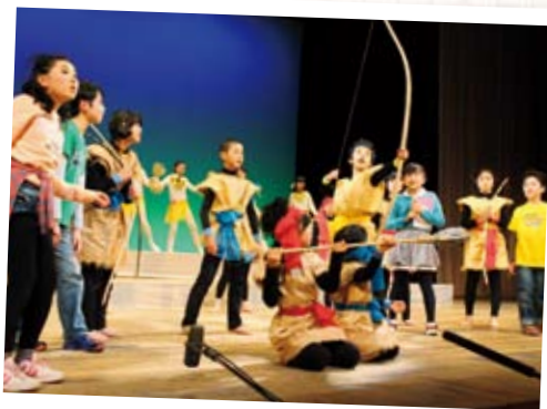
表現教育事業（こどもミュージカル）