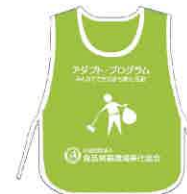
ビブス （サイド紐タイプ、フリーサイズ／着丈63cm×身丈50cm）