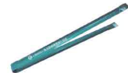
トンブ （サイズ 長さ30cm×幅2.3cm）