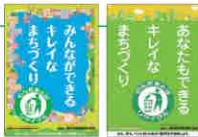
ポイ捨て防止の啓発ポスター

統一美化マーク(上記)のもと、各種媒体やメディアを通じて、散乱防止の啓発に努めています。これまで駅や社内のポスター・ステッカー、道路沿いの立看板、ポスターの掲出、バスラッピング広告など、時々の情勢に応じた方法で、散乱防止を呼びかけています。